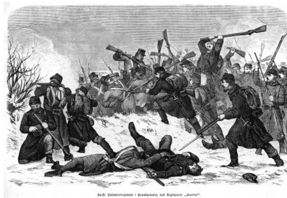
Træsnit, der viser en af de voldsomme kampe, krigen i 1864 kunne fremvise.